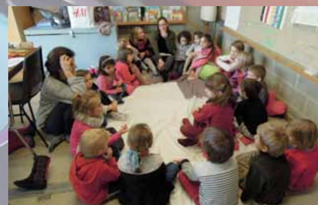
Atelier Cré-en couleur 6-7 ans