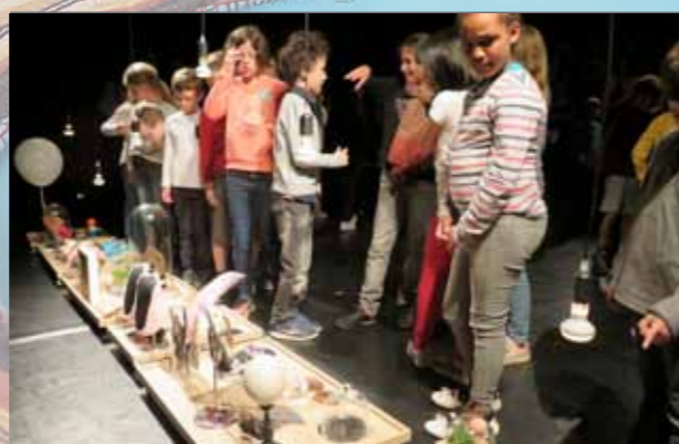
Rencontre spectacle Je suis une danseuse étoile