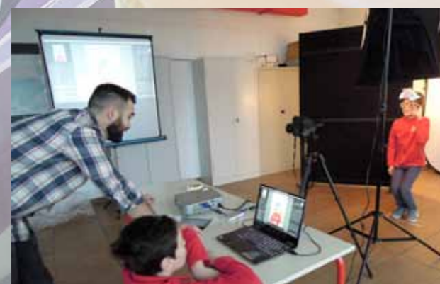
Atelier photo numérique 9-12 ans