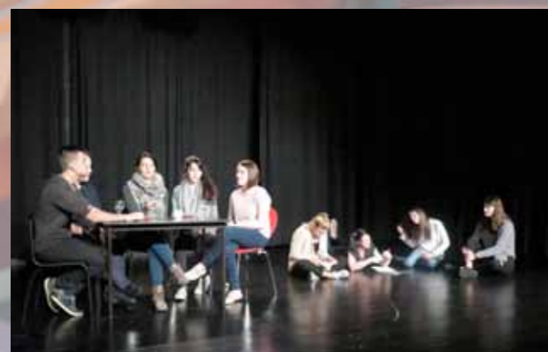
Art à l'école (ékla) : atelier Théâtre et Écriture avec l'HERS