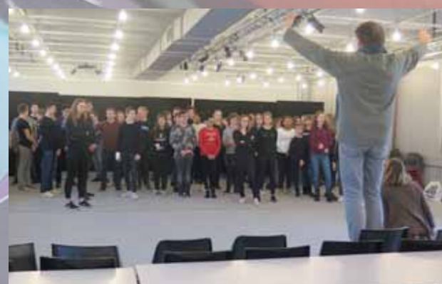
La Scène aux ados (lThAC) work in progress Avec l'INDA et l'Institut Sainte-Anne de Florenville