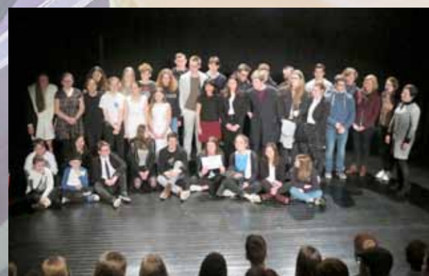
Festival Théâtre des langues Multi(l)lingues Avec RéseauLx.Langues