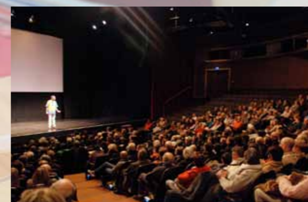
Spectacle Cela peut aussi nous arriver de Pie Tshibanda, organisé en partenariat avec JUDDU asbl