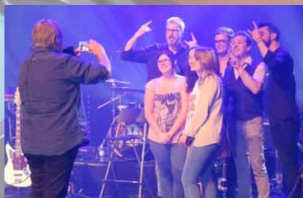
Concert A Rock n Roll Hits Story en représentation scolaire