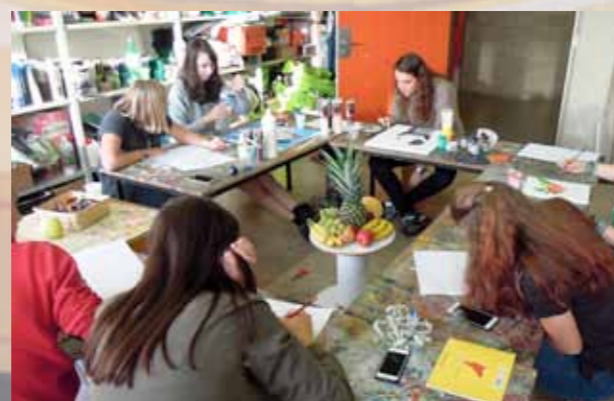
Atelier peinture ados