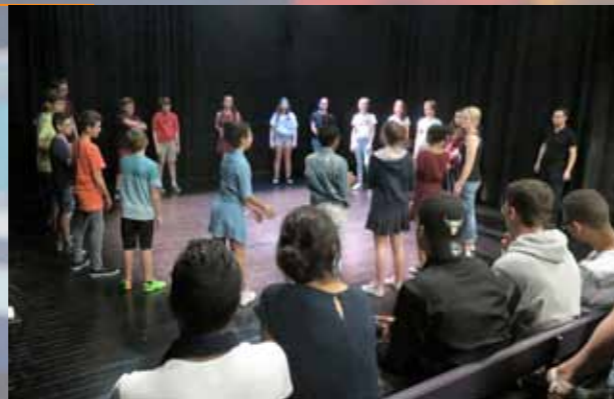
Art à l'école (ékla) : atelier Théâtre avec l'INDA