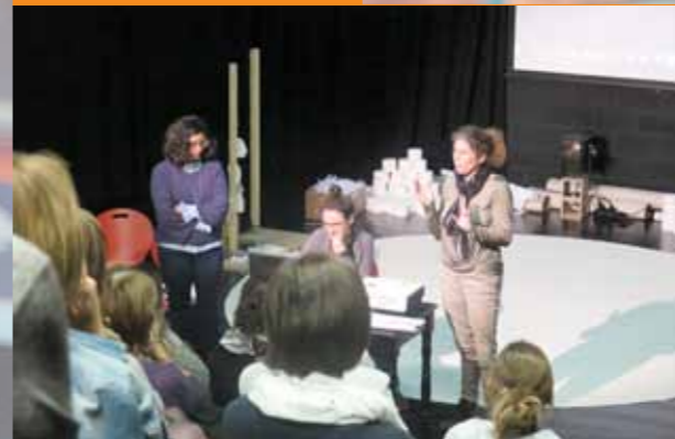
Formation petite enfance avec l'ONE et l'ASBL PromEmploi