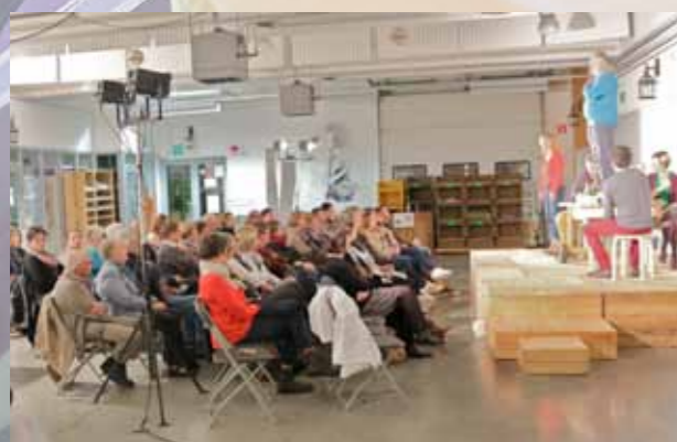
Festival AlimenTerre Spectacles Alimentaire mon cher Watson à la Halle de Han et le Pain des invités en scolaire