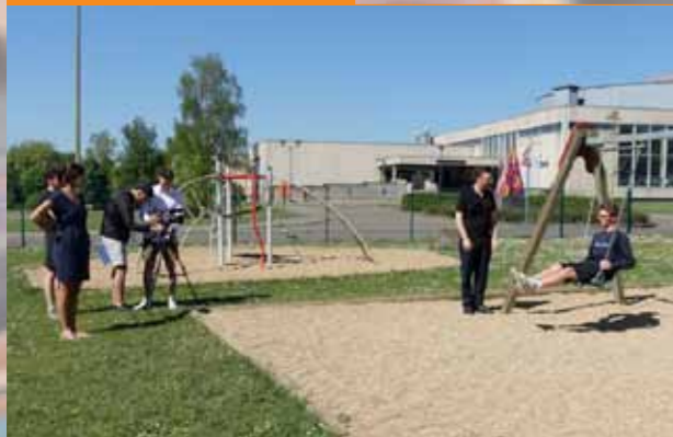
Art à l'école (ékla) : atelier Scénario avec l'ITELA