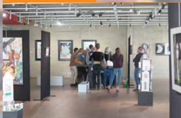
Visite guidée de l'exposition Dedans/dehors et atelier créatif