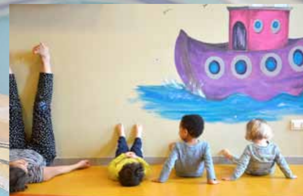
Atelier Voyage dansé dans les crèches