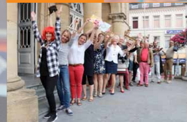
Dynamic, les rencontres culturelles de la ville d'Arlon