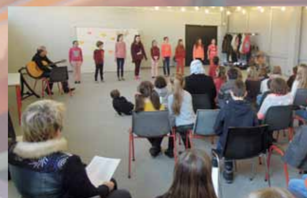
Journée de l'Amour