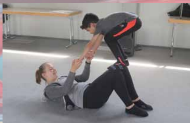
Art à l'école (ékla) : atelier Danse avec l'HERS et l'école Les Sources de Virton