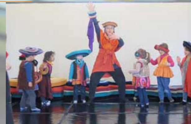
Exposition interactive Dedans/dehors par la Cie Iota