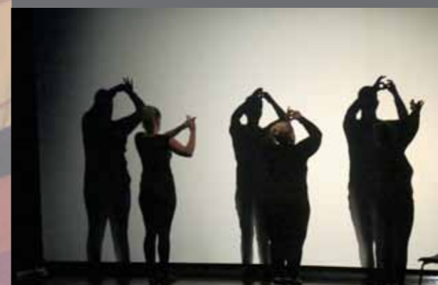
Atelier théâtre d'ombres

3 décembre, Journée internationale de la personne handicapée