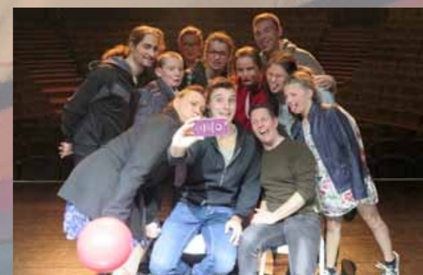
Les Fun en Bulles d'Arlon avec les Foutoukours du Québec