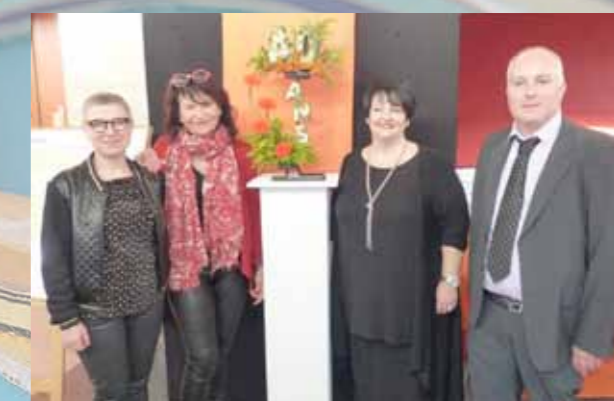
Les 40 ans de Téléaccueil Arlon, fêtés à la MCA !