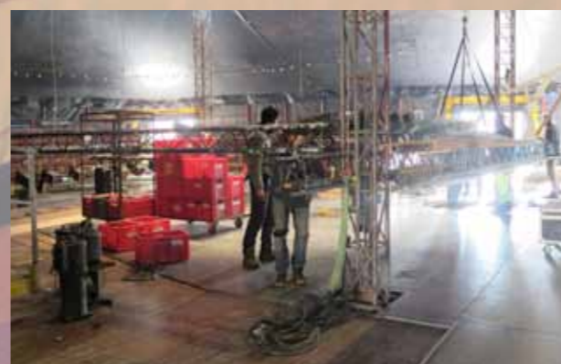
Montage du chapiteau avec les Baladins du Miroir