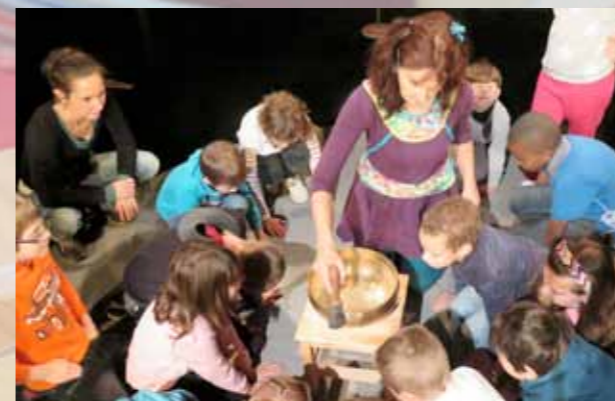
Spectacle Toutouwi : rencontre avec les enfants et atelier autour de la vibration avec des futurs puéricultrices