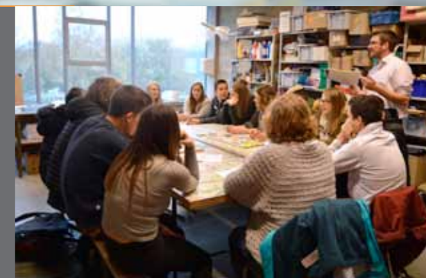
Fureur de jouer : Journée du jeu en famille et Journée professionnelle Des jeux et des métiers