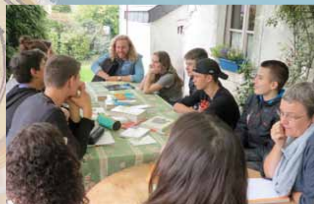
Après-midi littéraire Tilleul et Verlaine À Buzenol avec Tribal Souk