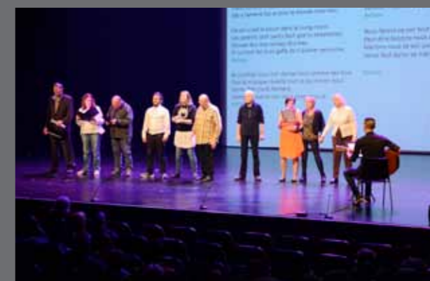
Atelier chant pop rock