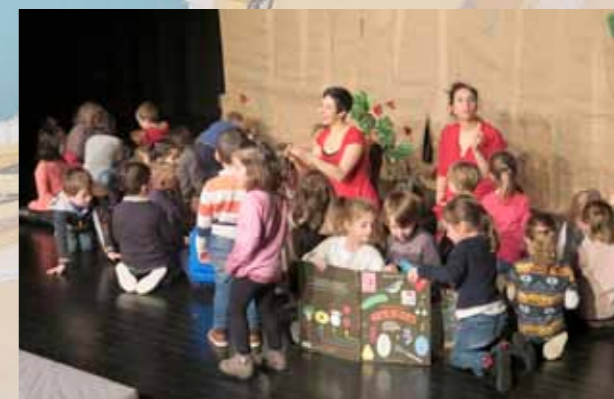
Rencontre spectacle Sous la feuille de salade