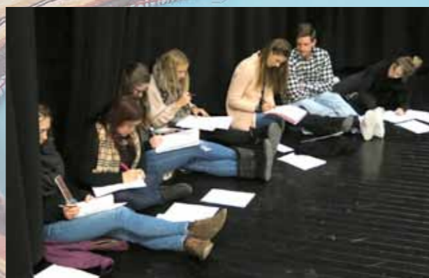
Atelier d'écriture géant avec l'auteure Véronique Daine