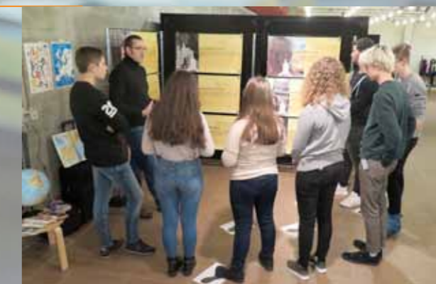
Migration : vivons la rencontre ! Animation avec Annocer la couleur